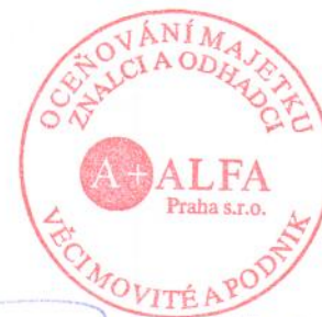
A+ALFA Praha s.r.o.

Slovy: Jednostřicetpětisícpětsetkorunčeských